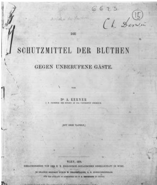
Abb. 1. Titelbild des Werkes »Die Schutzmittel der Blüten gegen unberufene Gäste« von A. Kerner, 1876, mit Signatur von C. Darwin.

Als Botaniker hat es mich natürlich besonders interessiert, seit wie lange Wissenschaftler schon darüber nachdenken, wie chemische Stoffe in Organismen wirken, wenn Pflanzen mit anderen Organismen in Wechselwirkung stehen. Dabei bin ich unter anderem auf Anton Kerner von Marilaun (1831–1898) gestoßen, einen österreichischen Botaniker in der zweiten Hälfte des 19. Jahrhunderts,